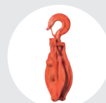
PASTECAS BISAGRA MODELO PBG Pág. 38