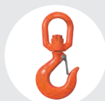
GANCHO CON PESTILLO GIRATORIO Pág. 82