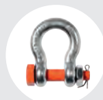
GRILLETES Pág. 103